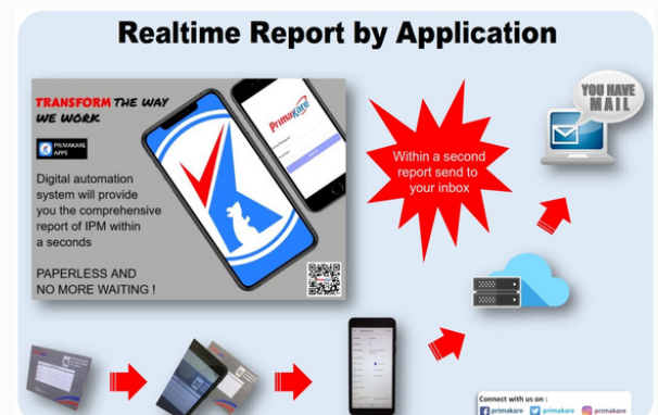
IMG. Flow-realtime report oleh aplikasi Primakare

Bukti bahwa kecepatan pelaporan pengendalian hama diterima oleh pengguna jasa adalah keharusan dalam era digitalisasi saat ini.